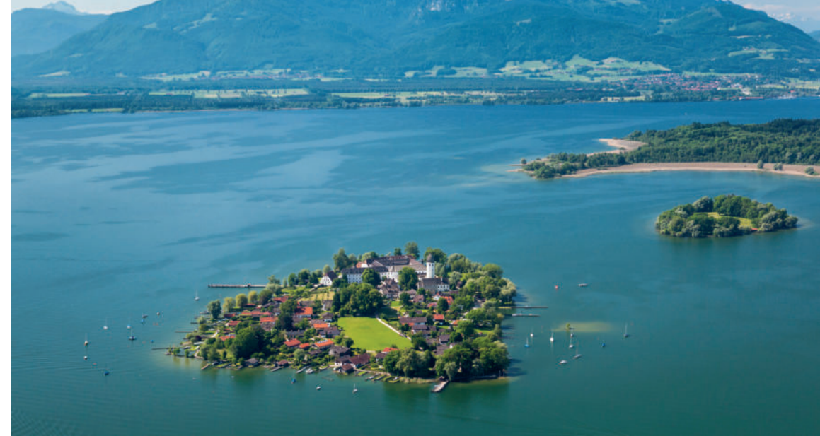
Blick auf die Fraueninsel und die Chiemgauer Alpen

Start VVK ab Montag, den 3. November 2025