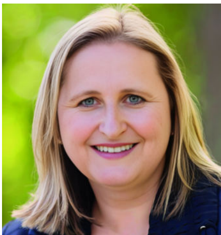
Carina Wacker Bürgermeisterin Gemeinde Schöneck