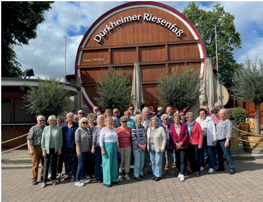
Besuch Dürkheim an der Weinstraße im Sommer 2024